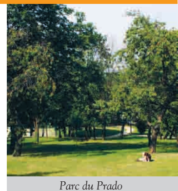
Parc du Prado