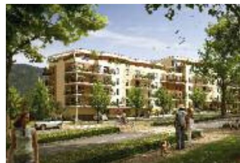
« Les Terrasses Semnoz » à Seynod

Présents en région Rhône-Alpes, Savoie, Pays de Gex, OGIC et son partenaire SOVALIM ont déjà signé de nombreuses réalisations sur le territoire. « Les Balcons du Clotet » à Annemasse, « La Balme Village » à la Balme de Sillingy, « Les Terrasses de Gex » et « Gex Panorama » à Gex, ou encore « Les Terrasses Semnoz », « Symphonie Semnoz » à Seynod figurent ainsi parmi les références d'OGIC.