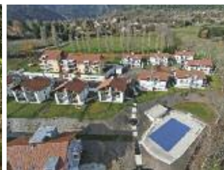
« Les Terrasses de Gex » à Gex