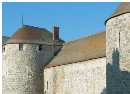
Le Château Fort du XIII e siècle