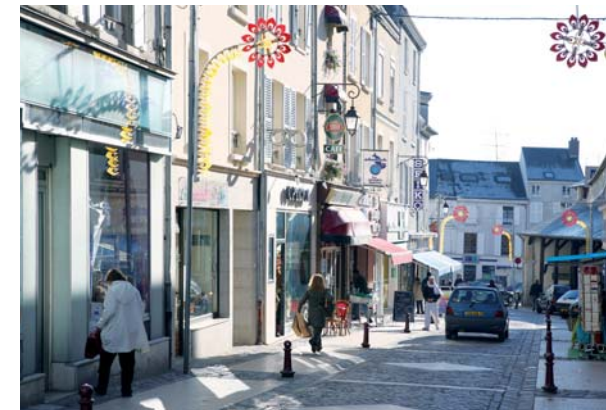
La rue de Chartres

Située dans le département de l'Essonne, proche de la vallée de Chevreuse, Dourdan possède un patrimoine naturel riche, varié et protégé comme en témoignent l'ancienne forêt royale, ou l'Orge sillonnant la commune. Capitale jadis du Hurepoix, fief originel des Capétiens, Dourdan possède en son centre un château fort du XIII e siècle, classé Monument historique, une église royale et une halle en bois, lieu de rencontre des Dourdannais.