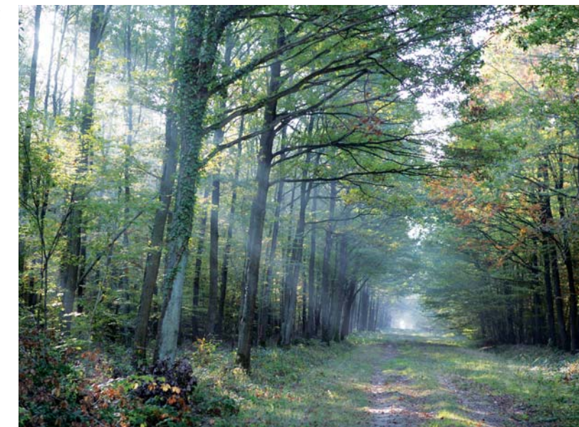
La Forêt de Dourdan

Une ville dynamique, des paysages variés, Dourdan jouit réellement d'un cadre de vie préservé pour tous ceux qui privilégient un certain art de vivre.