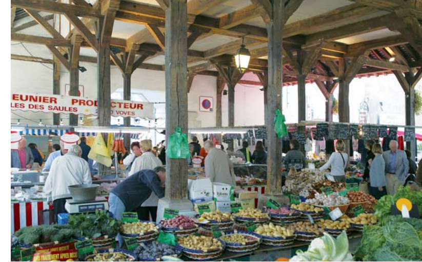
Le Marché Couvert