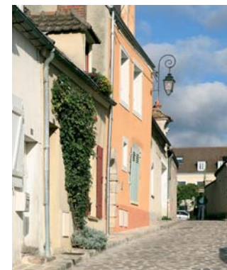
La rue des Fossés